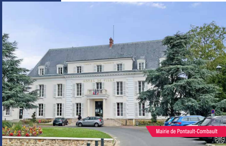
Mairie de Pontault-Combault

Située à une vingtaine de minutes au Sud-Est de Paris, Pontault-Combault est entourée de centaines d'hectares de forêts dont la forêt domaniale de Notre-Dame . Le parc de 4 hectares en centre-ville et les rues fleuries distinguées par les trois fleurs du label « Villes et villages fleuris » installent un cadre de vie agréable dans cette commune où dominent zones pavillonnaires et immeubles de petite taille. De nombreux commerces apportent vie et convivialité dans les rues.